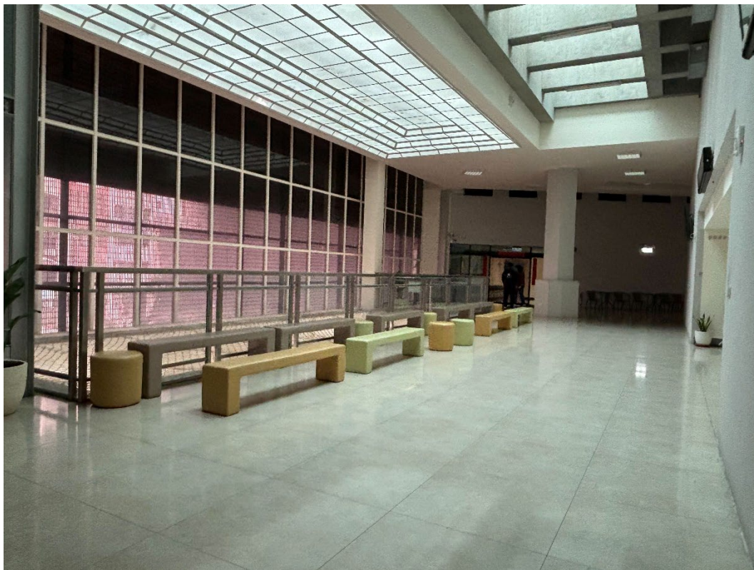
藝術館 2 樓 前方及兩側為化妝及選手準備區