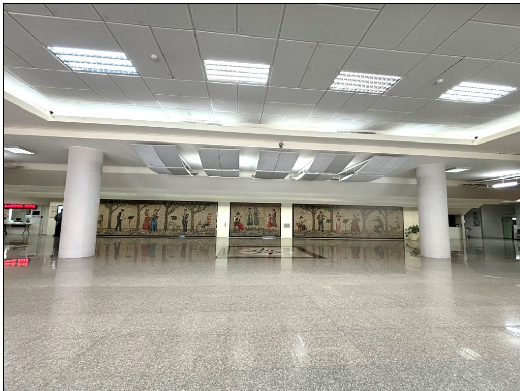
藝術館 1 樓大廳 為報到及選手檢錄區， 不開放暖身及置物