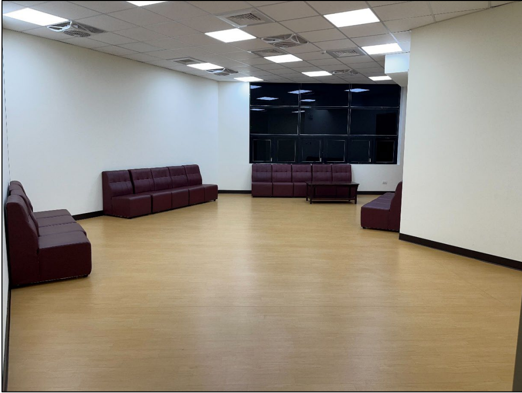
藝術館 2 樓更衣間 1、2 提供參賽舞者置物/更衣， 不可暖身用