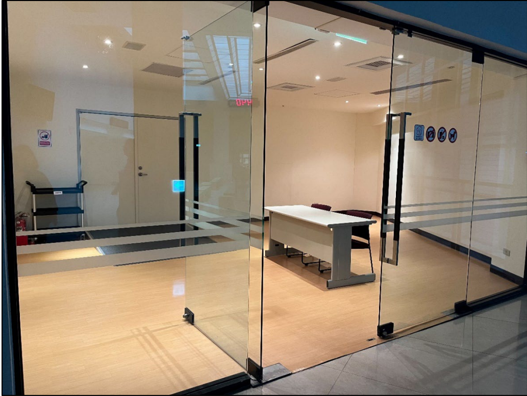
藝術館 2 樓服務櫃台