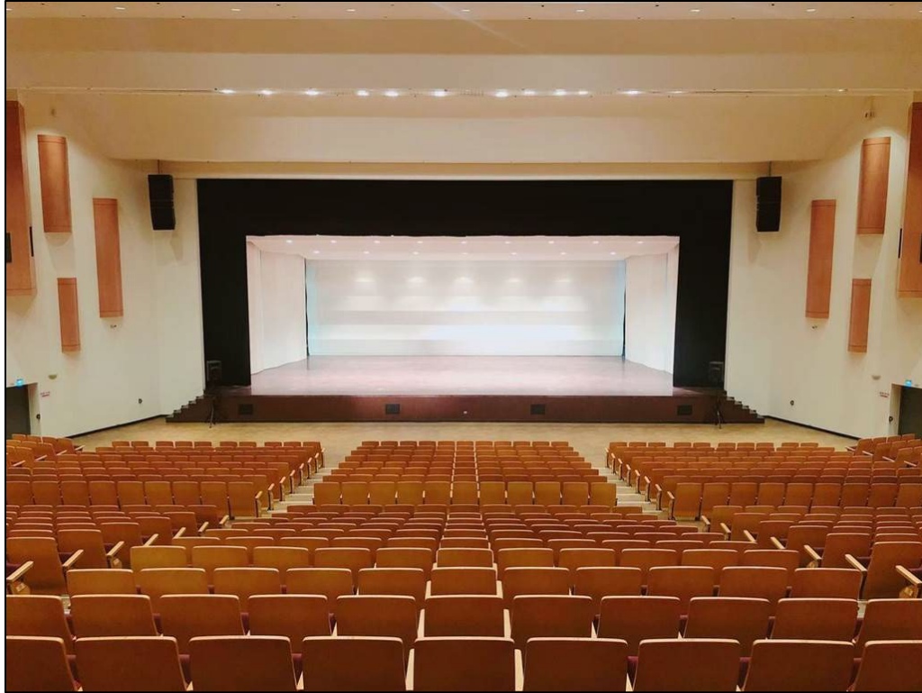
中壢藝術館音樂廳 為鏡框式舞台